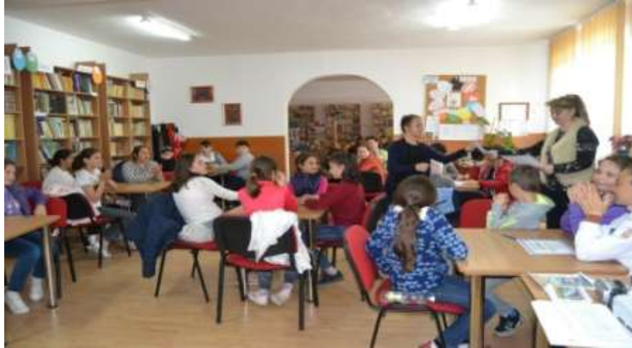
Bucuria locului I