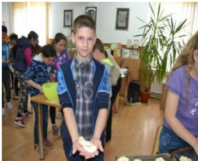
Ajutor de la colegii mai mari