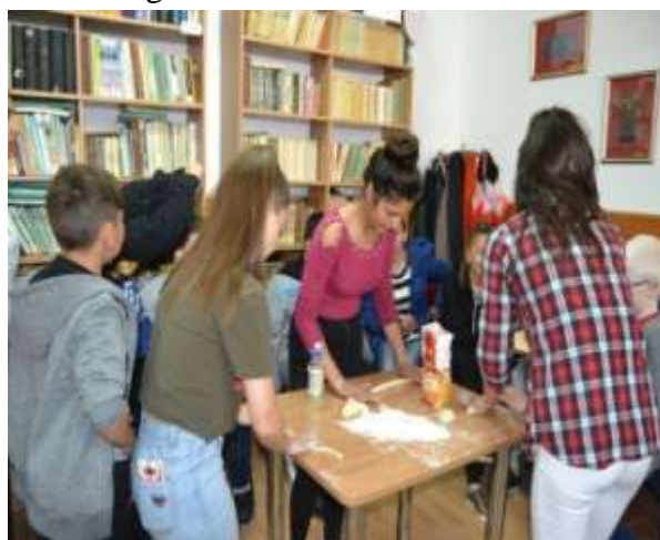
Bunătați oferite de gazde