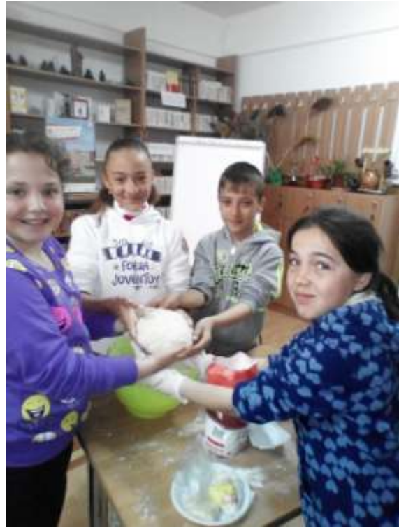
Controlul calității aluatului