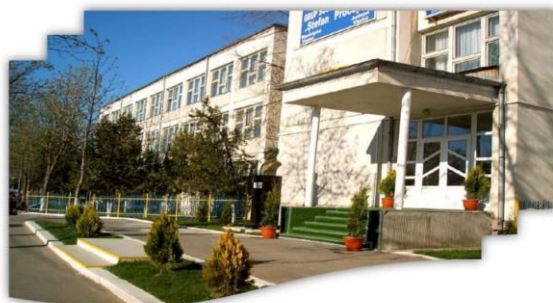
Liceul ”Ștefan Procopiu” Vaslui