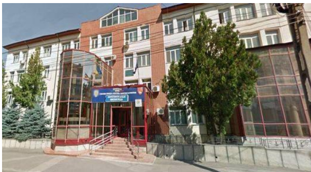
Inspectoratul Școlar Județean Vaslui

https://drive.google.com/file/d/1KUgdwF63HJvt1rrtKUfsN2JhbXPfe2pI/view?usp=drive link