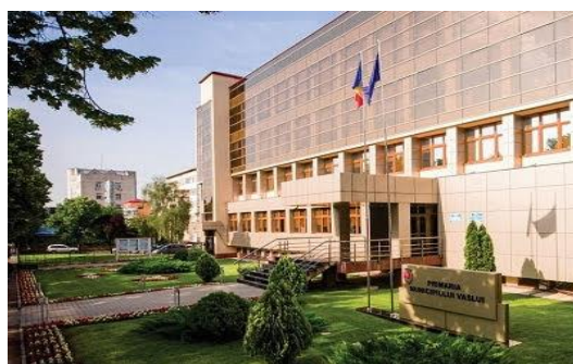
Primăria Municipiului Vaslui